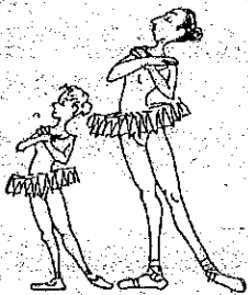
Anna è bassa. Paola è alta.

Note that an adjective that ends in -o usually refers to a male, and one that ends in -a to a female. An adjective that ends in -e may refer to either a male or a female.