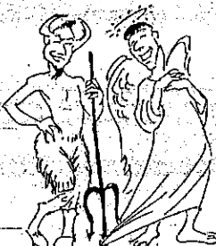
Il diavolo è cattivo. L'angelo è buono.